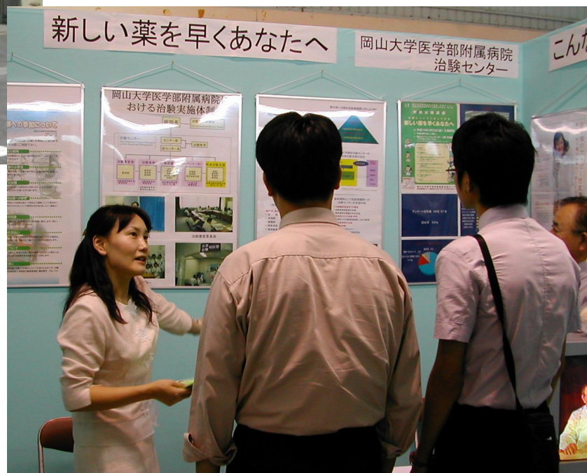
市民の方々に説明する 治験センターCRC