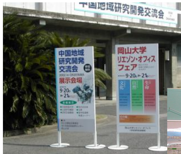
展示会場の 岡山大学清水記念体育館

治験センターとしては、治験（臨床研究）についての市民への啓発とセンターの業務の紹介を目的とし参加しました。治験センターのCRC 2名が、市民の方々からの治験についての質問に対してパネルやパンフレット等を用いて説明しました。